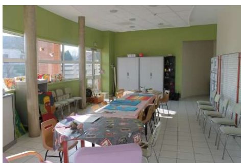
1 espace d'animation