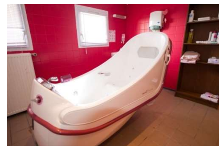
5 salles de bain adaptées aux personnes âgées et handicapées dont deux équipées en balnéothérapie