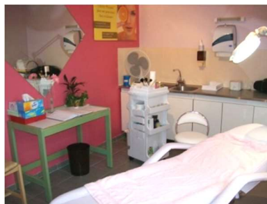
1 salon de soins esthétiques