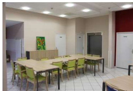
1 PASA (Pôle d'Activités et de Soins Adaptés) de 14 places