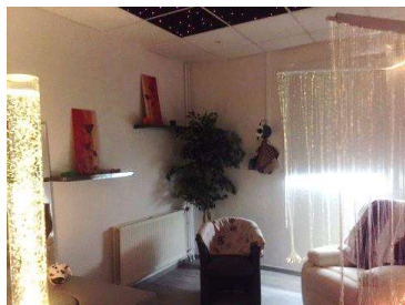
1 salle Snoezelen