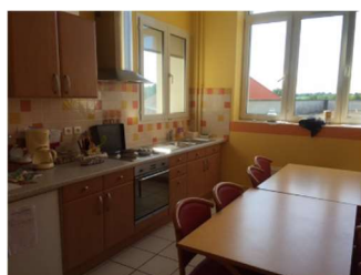
1 cuisine thérapeutique